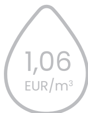
kanalizācijas pakalpojumu tarifu