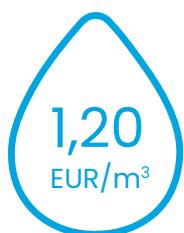
ūdensapgādes pakalpojumu tarifu

Līdz 2023. gada 1. jūnijam bija spēkā ar Sabiedrisko pakalpojumu regulēšanas komisijas padomes 2022. gada 25. augusta lēmumu Nr.127 “Par SIA “Rīgas ūdens” ūdenssaimniecības pakalpojumu tarifiem” apstiprinātie tarifi (bez pievienotās vērtības nodokļa):