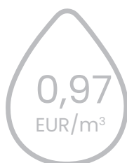
kanalizācijas pakalpojumu tarifu