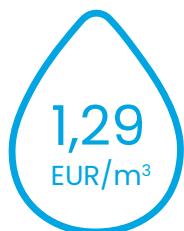
ūdensapgādes pakalpojumu tarifu

Plānotie ūdenssaimniecības pakalpojumu tarifi no 2024. gada 1. jūnija: