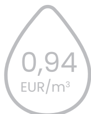
kanalizācijas pakalpojumu tarifu