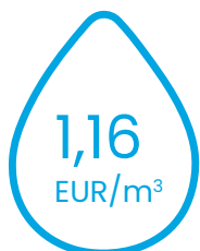
ūdensapgādes pakalpojumu tarifu

Sabiedrisko pakalpojumu regulēšanas komisijas padome ar 2023. gada 27. aprīļa lēmumu Nr.57 “Par SIA “Rīgas ūdens” ūdenssaimniecības pakalpojumu tarifiem” apstiprināja šādus tarifus (bez pievienotās vērtības nodokļa):