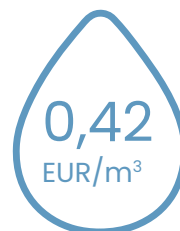
notekūdeņu attīrīšanas pakalpojumu tarifu

Laika periodā kopš pārskata gada pēdējās dienas nav bijuši citi notikumi, kas būtiski ietekmētu Sabiedrības finansiālo stāvokli 2023. gada 31. decembrī vai kas būtu papildus jāskaidro finanšu pārskata pielikumos.