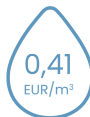
notekūdeņu attīrīšanas pakalpojumu tarifu

2024. gada 31. janvārī Sabiedrība iesniedza Regulatoram jaunu ūdenssaimniecības pakalpojumu tarifu projektu. Tiek prognozēts, ka jauni ūdenssaimniecības pakalpojumu tarifi varētu stāties spēkā no 2024. gada 1. jūnija.