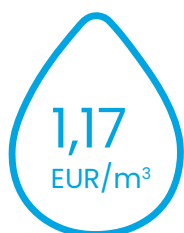
ūdensapgādes pakalpojumu tarifu

2024. gada 25. janvārī Regulatora padome pieņēma lēmumu Nr.2 “Par SIA “Rīgas ūdens” ūdenssaimniecības pakalpojumu tarifiem”, ar kuru no 2024. gada 1. marta tika apstiprināti sekojoši ūdenssaimniecības pakalpojumu tarifi (bez pievienotās vērtības nodokļa):