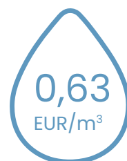
notekūdeņu attīrīšanas pakalpojumu tarifu

2023. gada 2. ceturksnī Sabiedrība noslēdz jaunu līgumu par elektroenerģijas piegādi, panākot būtisku elektroenerģijas izmaksu samazinājumu, kā rezultātā Sabiedrība iesniedz Regulatoram jaunu ūdenssaimniecības pakalpojumu tarifu projektu, būtiski, par 12,9% samazinot ūdenssaimniecības pakalpojumu tarifus.