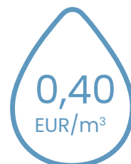
notekūdeņu attīrīšanas pakalpojumu tarifu

Pārskata gada peļņa, salīdzinot ar 2022. gadu palielinājās par 42,8% un veidoja EUR 7 533 tūkst.