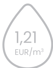
kanalizācijas pakalpojumu tarifu